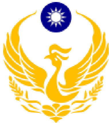
圖一：消防標幟火鳳凰