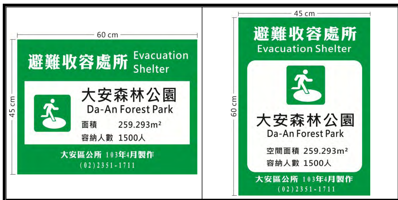
圖 1-3 避難收容處所告示牌 (樣式一)