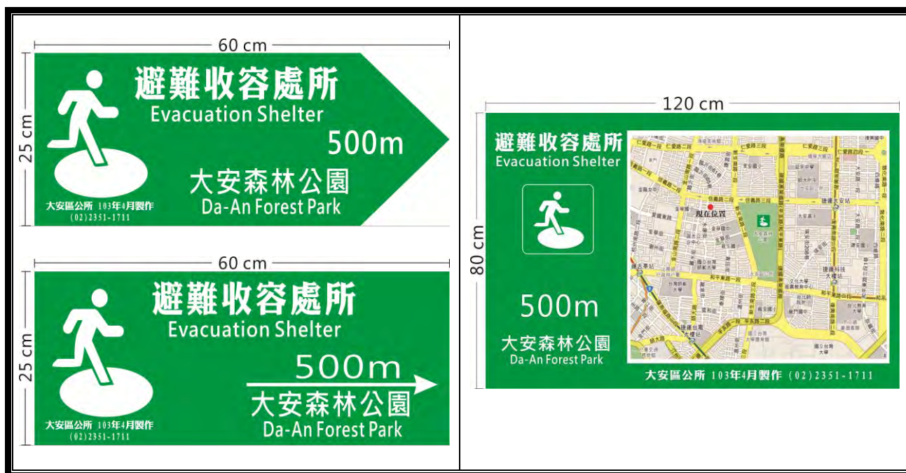
圖 1-1 避難收容處所方向指示牌 (樣式一)