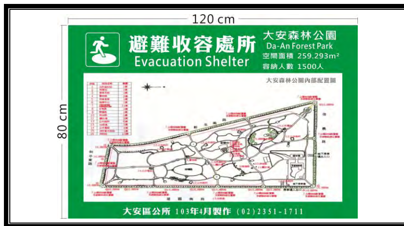
圖 1-4 避難收容處所告示牌（樣式二）