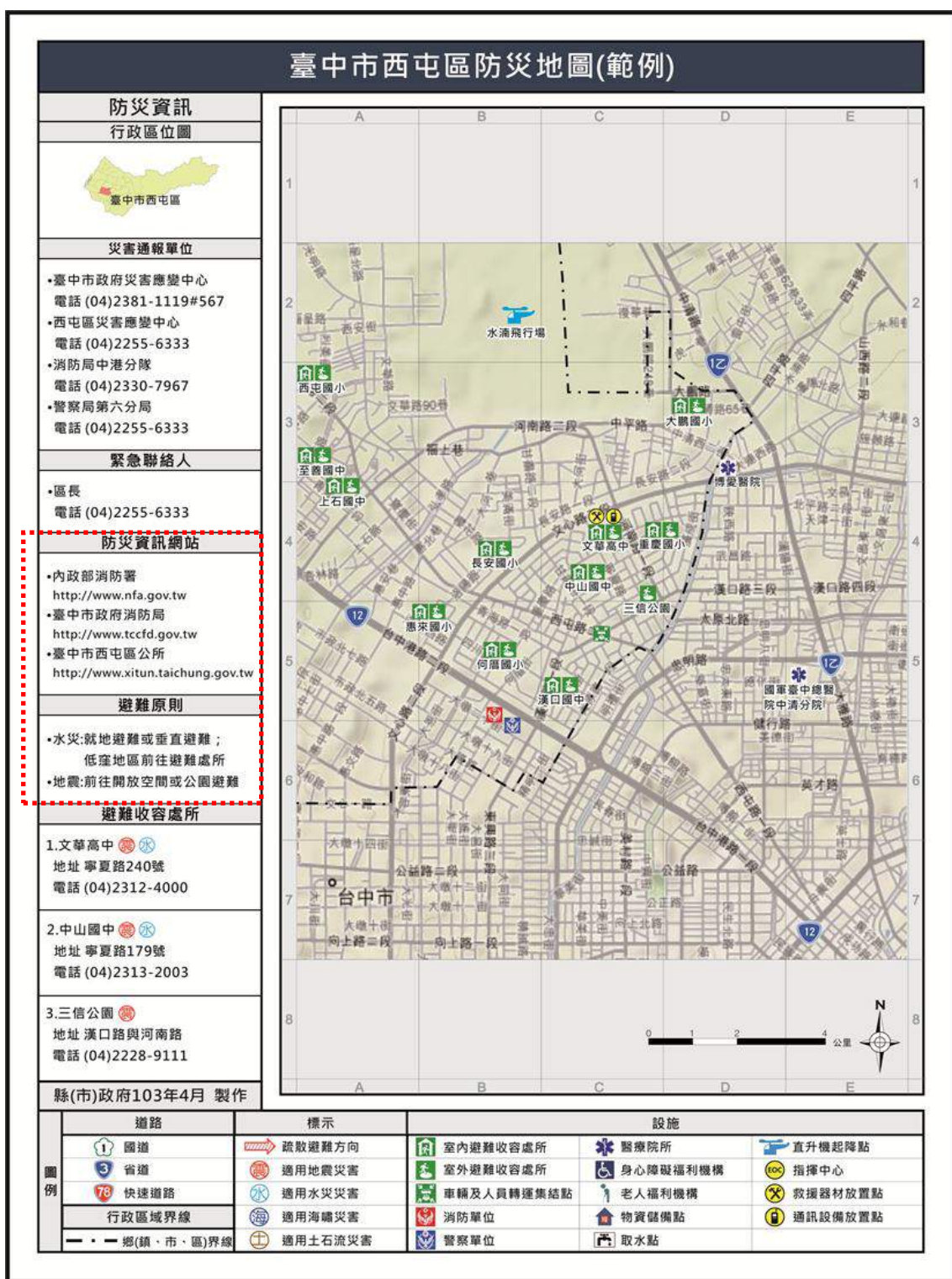
圖 2-2 臺中市西屯區防災地圖(範例)/直式