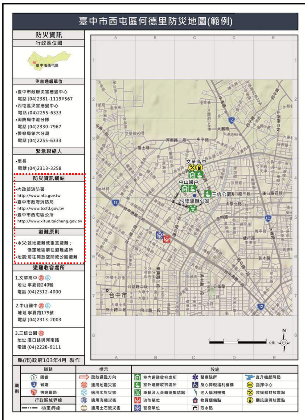
圖 2-4 臺中市西屯區何德里防災地圖(範例)/直式