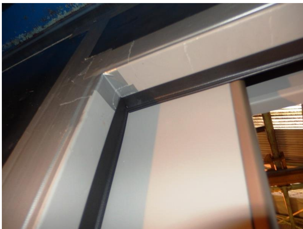
圖 2 上框密合設置之氣密膠