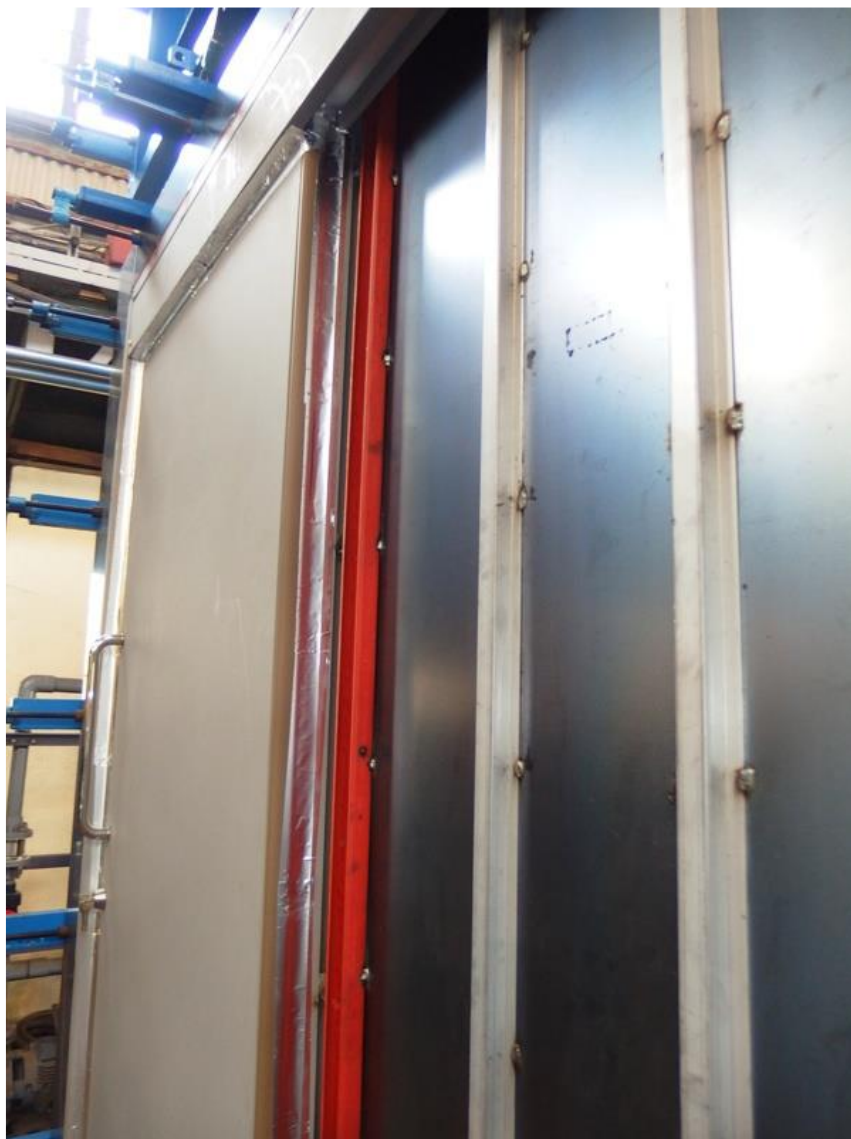
圖 6 交界處貼鋁膠帶