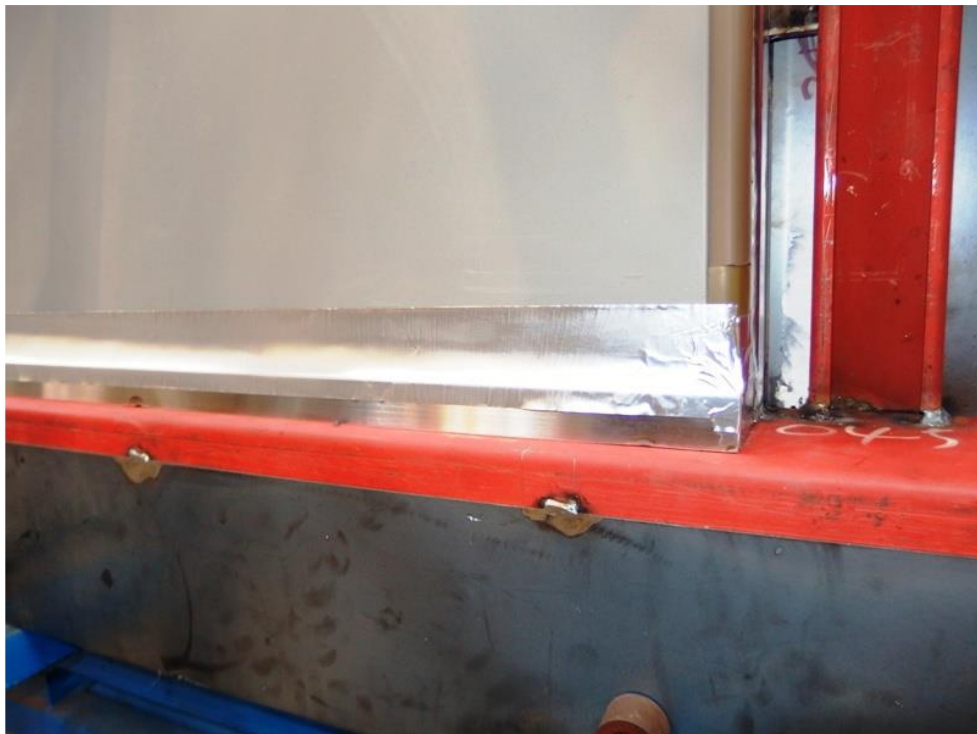
圖 5 下框和門間之鋁膠帶