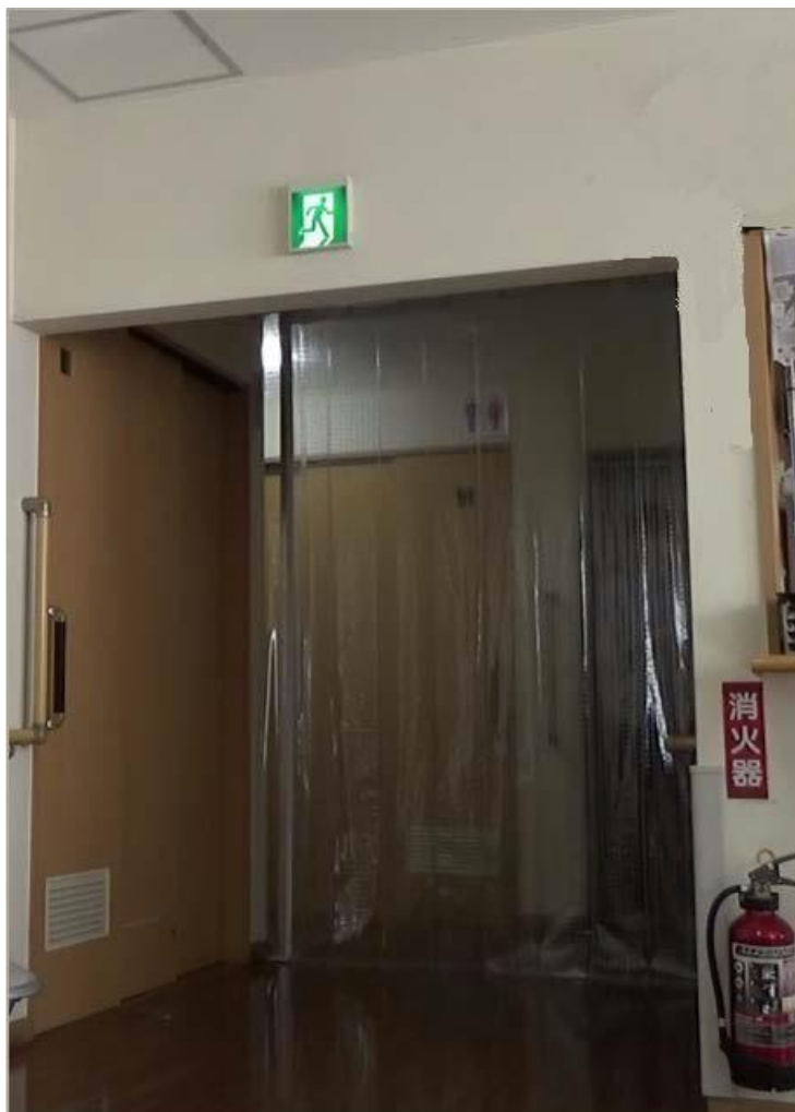
圖 7 走廊與居室間設置遮煙簾範例 (材質 簾子軌道：鋁、防煙簾：內有鋼絲)