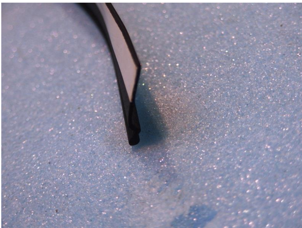
圖 1 門使用之氣密膠