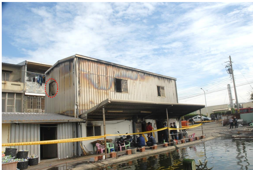
照片 一 ：建築物西南側外觀