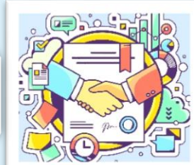
內政部消防署登錄之專業機構