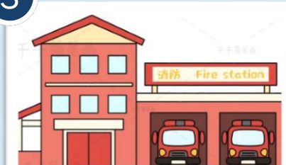
直轄市、縣(市)政府消防局